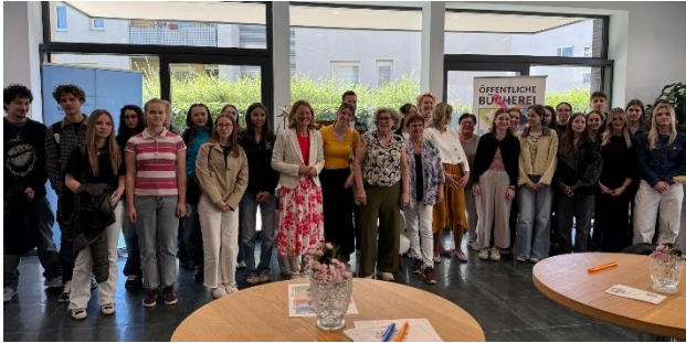
BU: Schüler:innen am Vormittag zu Besuch bei der Living Library