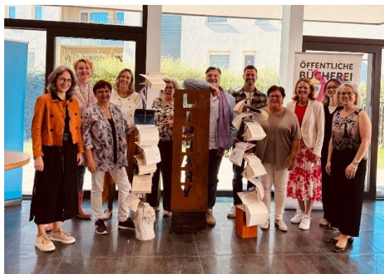
BU: Die „lebenden Bücher“ 2026