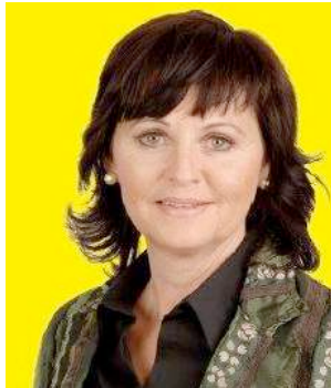
Vizebürgermeisterin und Sozialreferentin der Stadt Wörgl

Mit der vorliegenden Broschüre möchten wir die Bedeutung von Ehrenamt und freiwilligem Engagement für die Gesellschaft verdeutlichen und einen Einblick in die vielfältigen Leistungen geben.