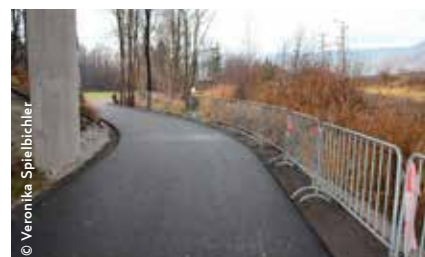
Die neu asphaltierte Radweg-Verbindung unter der Brücke des Autobahnzubringers Wörgl-West

Etzelstorfer, weshalb mit den Arbeiten auf den Abschluss der Formalitäten gewartet wird. Das neue Radweg-Stück kostete 160.000 Euro, wovon das Land Tirol die Hälfte übernimmt und Wörgl und Kundl je ein Viertel der Kosten tragen.