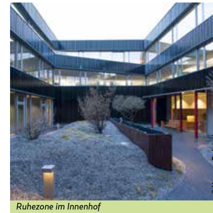
Ruhezone im Innenhof

Mit dem Berger Logistik Forum verfügt das Haus ferner über einen Saal mit modernster Technik und variabler Größe, der bis zu 180 Personen Platz bietet. Er steht sowohl für betriebsinterne Schulungen und Vorträge als auch für Seminare sowie Kunst- und Kulturveranstaltungen mit öffentlichem Charakter bereit. Dazu kooperiert das Unternehmen mit externen Veranstaltern.