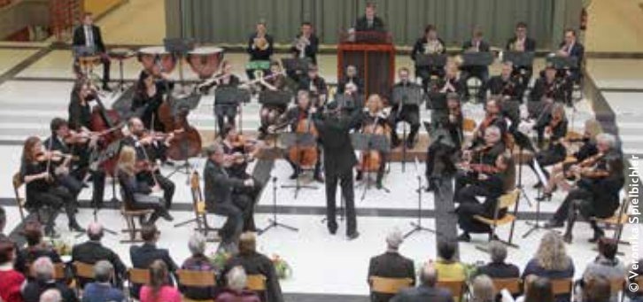
Zum fünften Mal lud heuer das Wörgler Streicher- und Bläserensemble zum Neujahrskonzert.