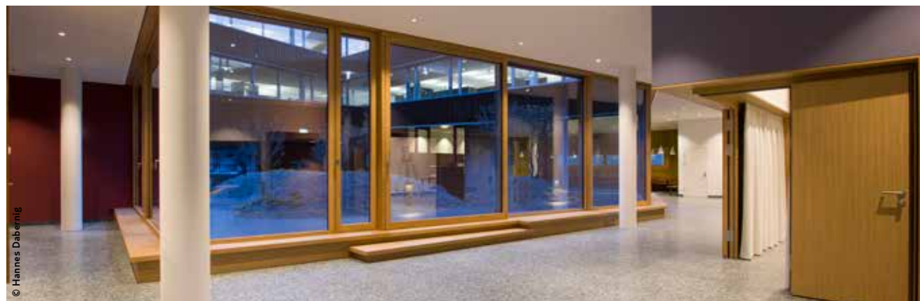
Foyer mit Eingang in das Berger Logistik Forum (Veranstaltungssaal)