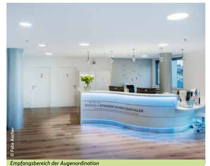
Empfangsbereich der Augenordination