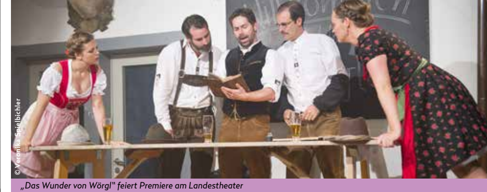
„Das Wunder von Wörgl“ feiert Premiere am Landestheater