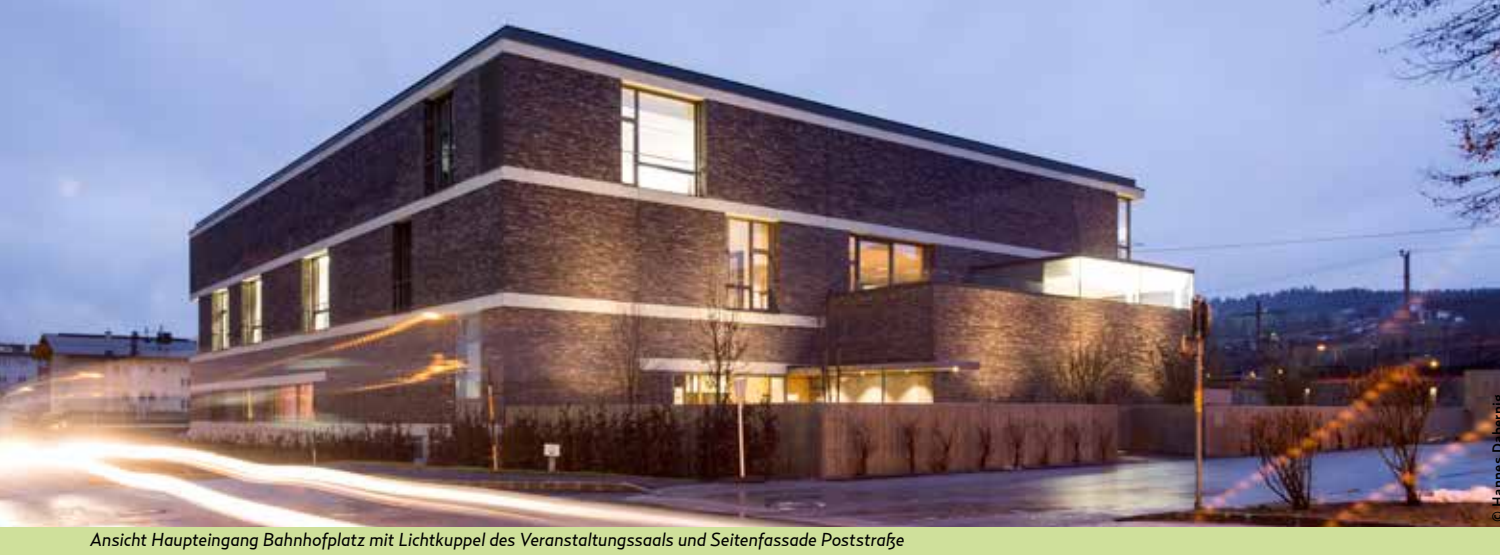
Ansicht Haupteingang Bahnhofplatz mit Lichtkuppel des Veranstaltungssaals und Seitenfassade Poststraße