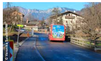
Mit der Neutrassierung wurde die Citybus-Haltestelle neu positioniert.

Weitere Informationen finden Sie unter: www.woerglweb.at