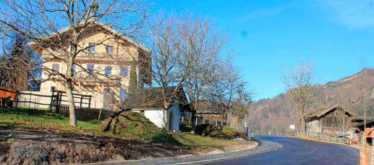
Die Neutrassierung der Brixentaler Gemeindefraße im Ortsteil Pinnersdorf hält mehr Abstand zum ehemaligen Gasthof Pinnersdorf.