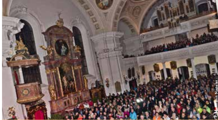
Die Pfarrkirche Brixen i. Th. war beim Benefizkonzert bis auf den letzten Platz gefüllt.