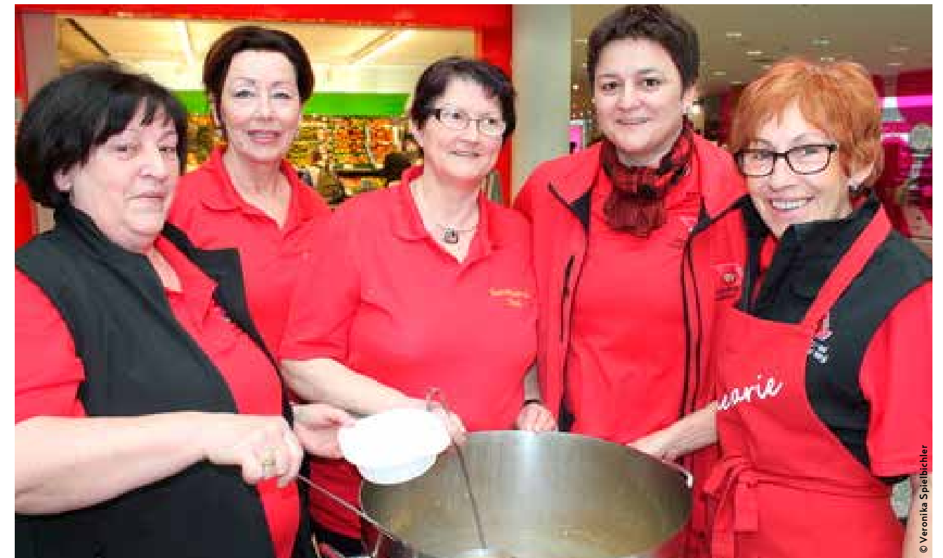
Der Gesundheits- und Sozialsprengel läutet auch heuer wieder die Fastenzeit ein

heits- und Sozialsprengel bietet auch heuer wieder die schon zur Tradition gewordene Fastensuppe an. Von 10.00-13.00 Uhr wird die vom Küchenteam des Seniorenheims zubereitete Fastensuppe im City Center angeboten. Der Gesundheits- und Sozialsprengel freut sich auf Ihr Kommen!