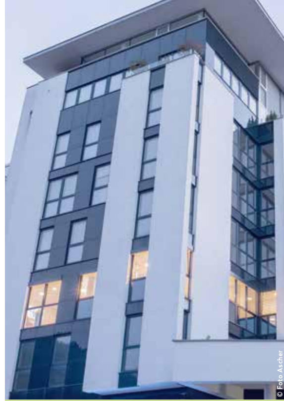
In die Ordination im 3. OG der Bahnhofstraße 8 führt ein Aufzug