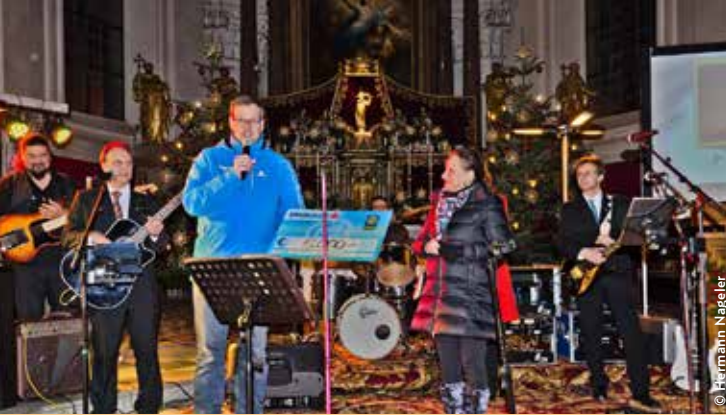
Der Rotary Club Brixental übergab beim Benefizkonzert einen Spendenscheck über 5.000 Euro.