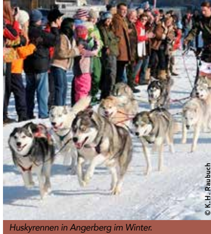
Hundeschlittenrennen in Angerberg - ein großes Event in der Ferienregion Hohe Salve.