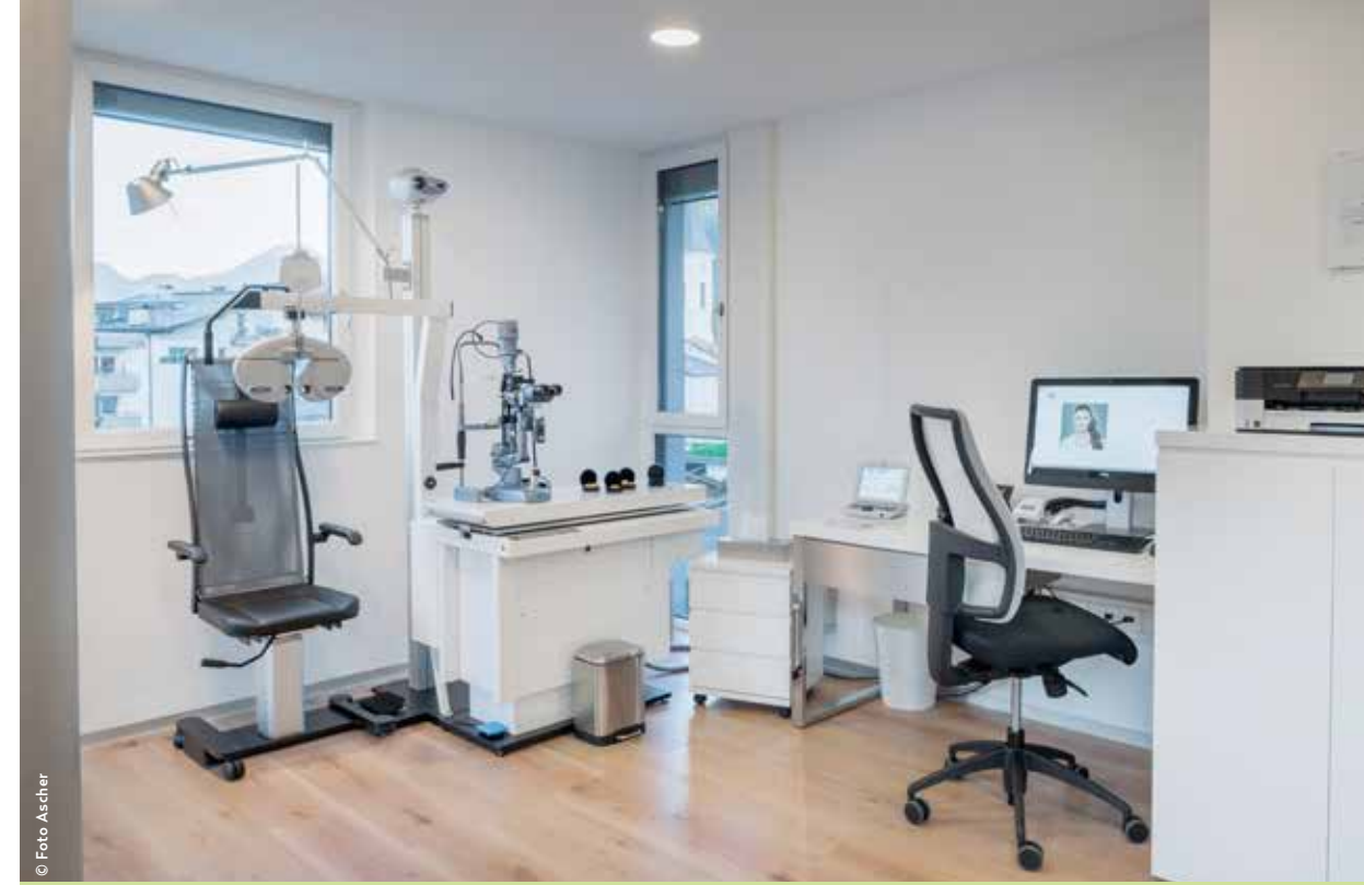
Einer der drei modern ausgestatteten Untersuchungsräume