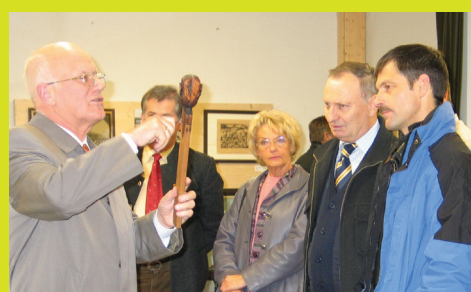
Heimatmuseum, Brixentaler Straße 1

Wörgl, am Schnittpunkt der Verkehrsadern in alle vier Himmelsrichtungen gelegen, war bereits vor 2700 Jahren ein Handelszentrum von überregionaler Bedeutung. Im Heimatmuseum der Stadt finden sich Exponate zu Wörgls älterer und jüngerer Geschichte, wobei sich ein eigener Ausstellungsbereich dem Wörgler Freigeld widmet. Im Museum findet sich noch ein weiteres ergänzendes Zahlungsmittel, das in Wörgl über Jahrhunderte bis 1870 verwendet wurde: Kerbhölzer dienten zur Organisation der Arbeiten zur Erhaltung der gemeinschaftlich genutzten landwirtschaftlichen Flächen und machten so Steuerzahlungen in Geld für diese Leistungen überflüssig.