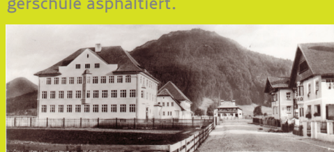
Foto oben: Bürgerschule; Foto links: Die Raiffeisenkasse Wörgl war Partner der Nothilfe-Aktion – hier konnten Geschäftsleute Freigeld umwechseln

anstieg, ging sie in Wörgl um 16 % zurück. Zum Bauprogramm zählten Straßenbau- und Kanalisierungsarbeiten im gesamten Ortszentrum sowie die Errichtung von Infrastruktur für den aufkeimenden Tourismus. Im Zuge der Arbeiten wurde 1932 der Bereich vor der neu errichteten Bürgerschule asphaltiert.