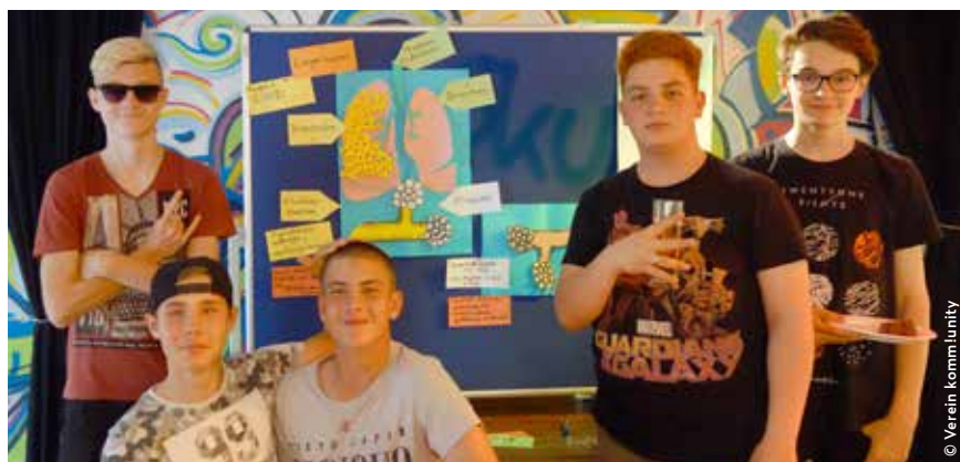
Hier haben die Jugendlichen an einem Modell der Lunge den Weg des Nikotins in den Körper kennengelernt und sich mit den Auswirkungen von Nikotinkonsum auf den Körper auseinandergesetzt.

Die Gefahren und Auswirkungen von Nikotin, Alkohol und Cannabis wurden in verschiedenen Stationen bearbeitet und boten mit interaktiven Spielen und viel Information einen kritischen Blick auf Sucht und Konsum. Auch das Thema Jugendschutz wurde in einem spannenden Quiz bearbeitet und viele Fragen rund um Suchtverhalten konnten in einer gemeinsamen Fragerunde besprochen werden. Damit wurde ein reichhaltiges Angebot zum Thema Suchtprävention geschaffen und soll auf jeden Fall wiederholt werden. Als klares Ziel der Präventionsarbeit