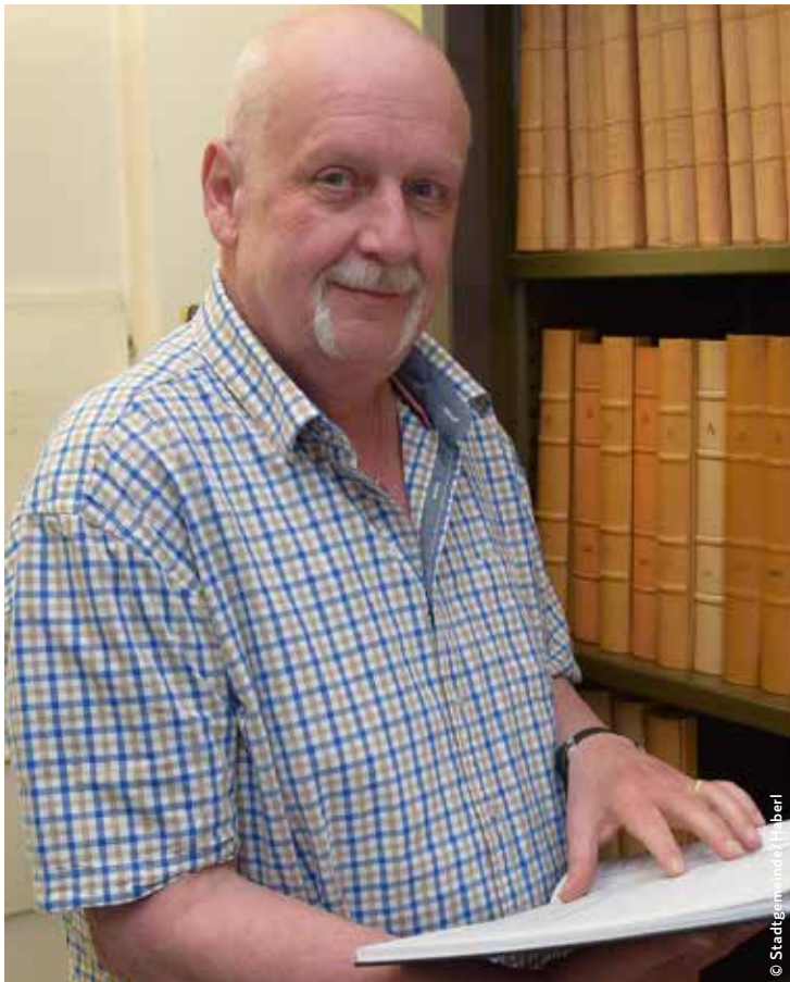
Bis vor drei Jahren wurden alle Geburten, Eheschließungen und Sterbefälle noch in Büchern erfasst. Jetzt wird das Personenstandsregister nach und nach digitalisiert.

Biomüllsäcke und Energycards erhältlich.