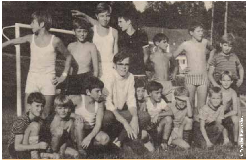
Die Jungschartuppe von 1970

Für Ordnung und Disziplin sorgten die sogenannten „Zimmer Häuptlinge“, die ihre Sache hervorragend meisterten und dazu beitrugen, dass die Woche ein Erlebnis für