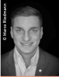
© Marco Riedmann Junge Wörgler Liste GR Michael Riedhart

Bald ist es soweit, am 8. Juli wird das neue Wörgler Stadtfest stattfinden. Letztes Jahr wurde der Antrag von uns (Junge Wörgler Liste), in Kooperation mit den beiden bürgerlichen Listen, im Gemeinderat ein-