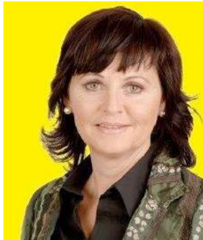
Vizebürgermeisterin und Sozialreferentin der Stadt Wörgl

Mit der vorliegenden Broschüre möchten wir die Bedeutung von Ehrenamt und freiwilligem Engagement für die Gesellschaft verdeutlichen und einen Einblick in die vielfältigen Leistungen geben.