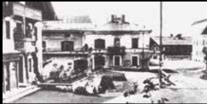
Die Innsbrucker Straße ca. 1914