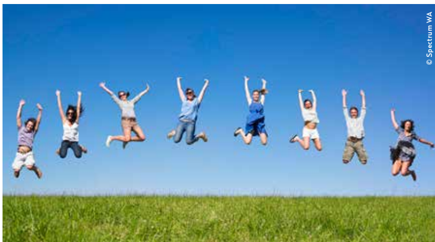
Insgesamt 8 Wörglerinnen und Wörgler werden Wörgl noch heuer ein neues Gesicht geben!

ausdrückliche Zustimmung von Dir/ bzw. deines Erziehungsberechtigten! • Du bekommst deine Profi-Fotos in verschiedenen Settings geschenkt!