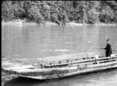
Sepp Leiminger vor 1970 als Schiffsführer