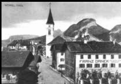
Beginn der Innsbrucker Straße um 1920