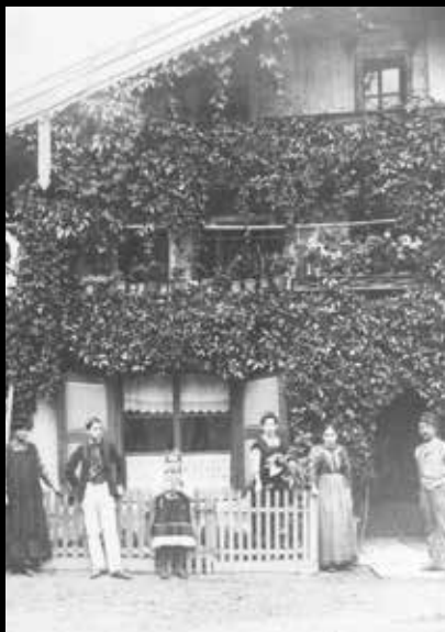
Dreifaltigkeitshaus um 1918, jetzt Wildschönauer Straße 3b