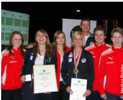
Staatsmeisterschaft: das Team der sga bei den Staats Meisterschaften in Wienschung.

Somit kann die Schützengilde Angerberg auf eine sehr erfolgreiche Teilnahme bei der Luftgewehrstaatsmeisterschaft zurück blicken.